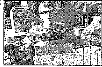
IN PIAZZA UGUALMENTE Alcuni studenti grevigiani si sono presentati ugualmente sotto il monumento di Giovanni da Verrazzano