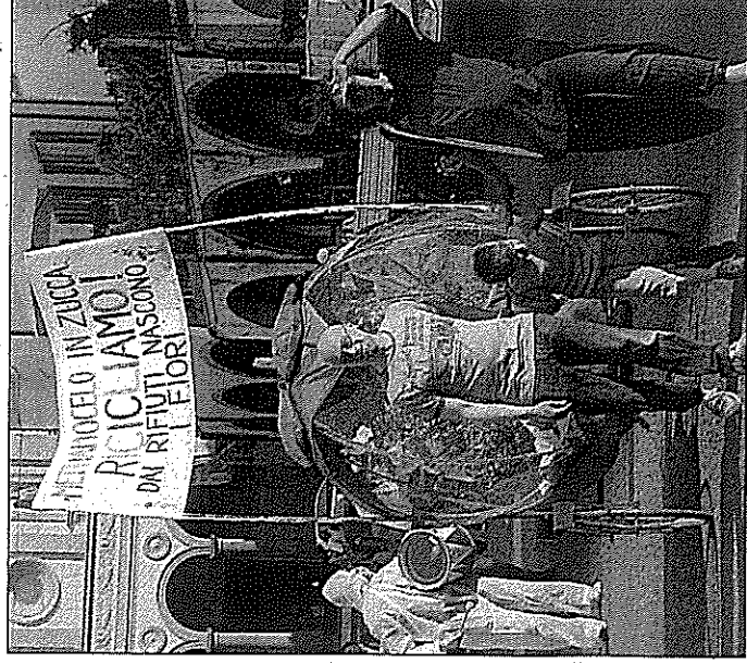
No a Testi Sopra la manifestazione di due settimane fa

Dello stesso parere, anche se da un fronte diverso, quello